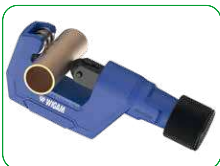
Taglio del tubo