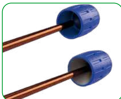
Pulizia interna ed esterno del tubo con sbavatubo