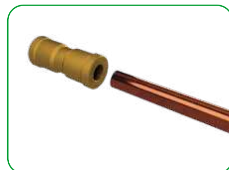
Inserimento del tubo sul raccordo IPER-LINK

Per le istruzioni complete fare riferimento al manuale