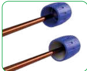
Inner and outer cleaning of the hose with an inner/outer reamer