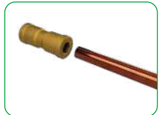
Insertion of the hose on the IPER-LINK

For complete instructions, see the user's manual