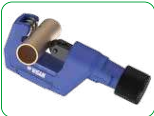
Cutting the hose