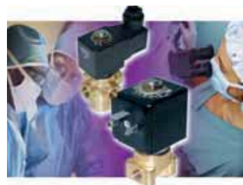
Medicale / Strumentazione