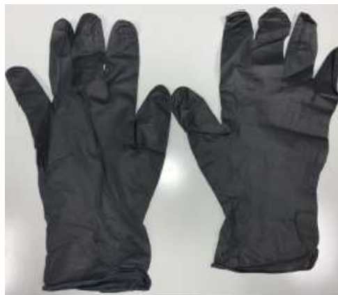
FOTO GUANTO PHOTO OF GLOVE

The PPE type complies with the applicable essential health and safety requirements of Regulation (EU) 2016/425.