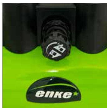
REGOLATORE DI PRESSIONE PRESSURE REGULATOR