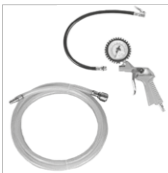
MANOMETRO TIRE METER