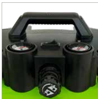
MANOMETRO PRESSURE GAUGE

Batteria e caricabatterie non inclusi / Battery and charger not included