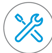
Facile da installare

Le immagini dei prodotti e degli accessori sono da considerarsi indicative. Le caratteristiche sopra riportate possono subire variazioni senza alcun obbligo di preavviso.