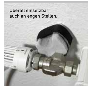
Überall einsetzbar, auch an engen Stellen.