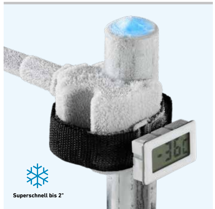
Superschnell bis 2"

LCD-Digital-Thermometer mit Klemmbügel, für genaue Temperaturanzeige direkt an den Einfrierstellen.