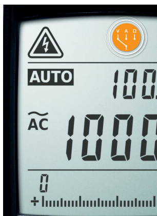
Riconoscimento automatico dei parametri di misura.