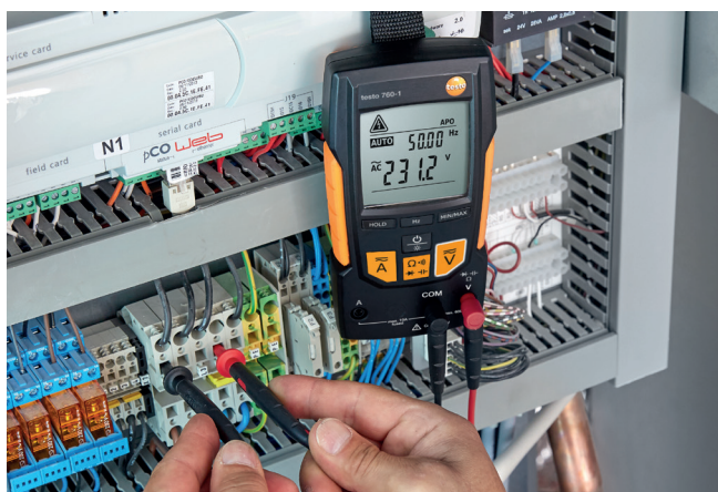
Prova di tensione nel quadro elettrico di una pompa di calore.