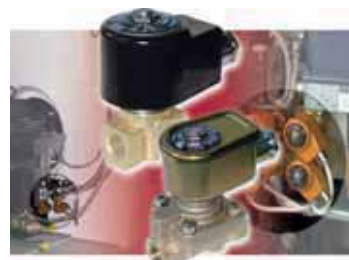
Sistemi di Riscaldamento