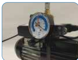
Collegamento con pompa per vuoto