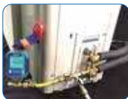
Vacuum with VG64-LX digital gauge