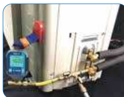
Vuoto con vacuometro VG64-LX