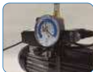
Connection with vacuum pump